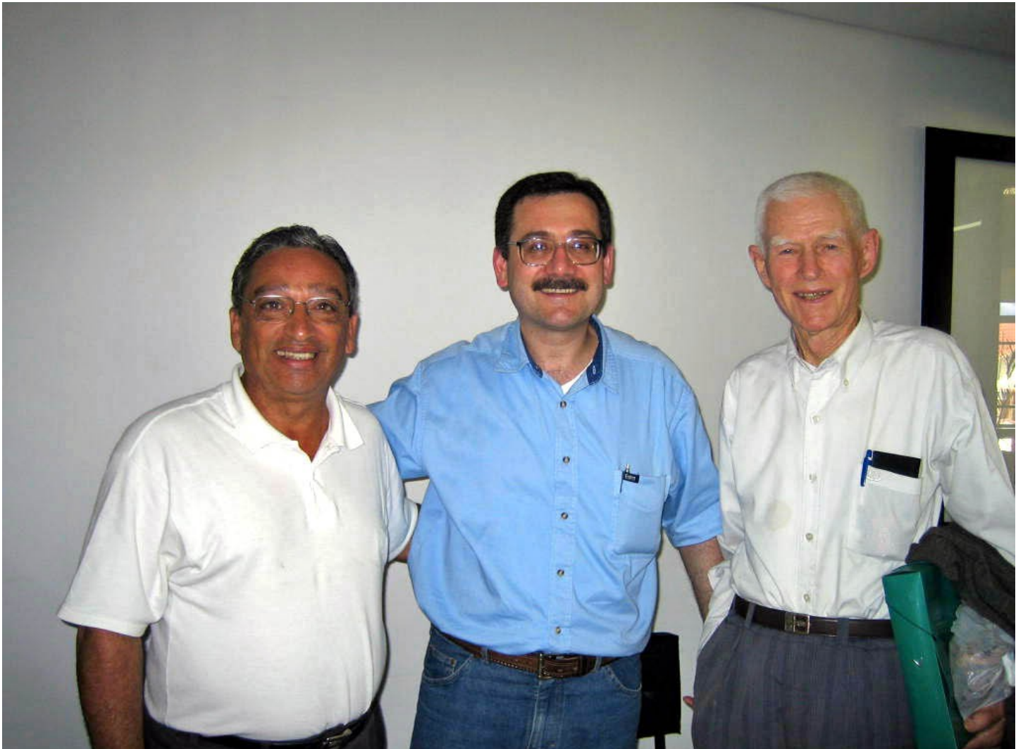
La tri amikoj: Amikeco tridekjara inter PY3BZM, PY3DF kaj PY3ACE